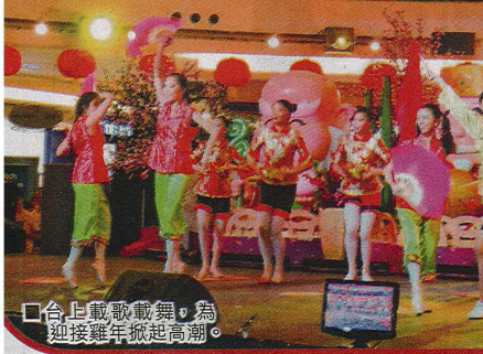
台上載歌載舞，為迎接雞年掀起高潮。